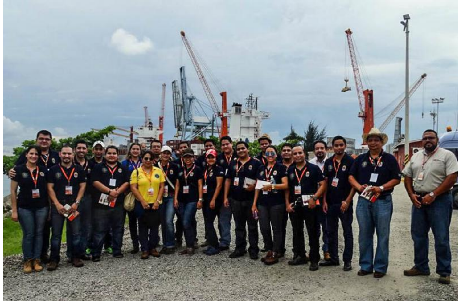
Visita a la Operadora Portuaria Centroamericana (OPC) 2015

Los objetivos del viaje fue realizar un estudio de campo sobre las operaciones y procedimientos llevados a cabo con la recepción de embarcaciones y mercancías en la terminal de contenedores del referido puerto para proponer un marco jurídico que eficiente los servicios portuarios.