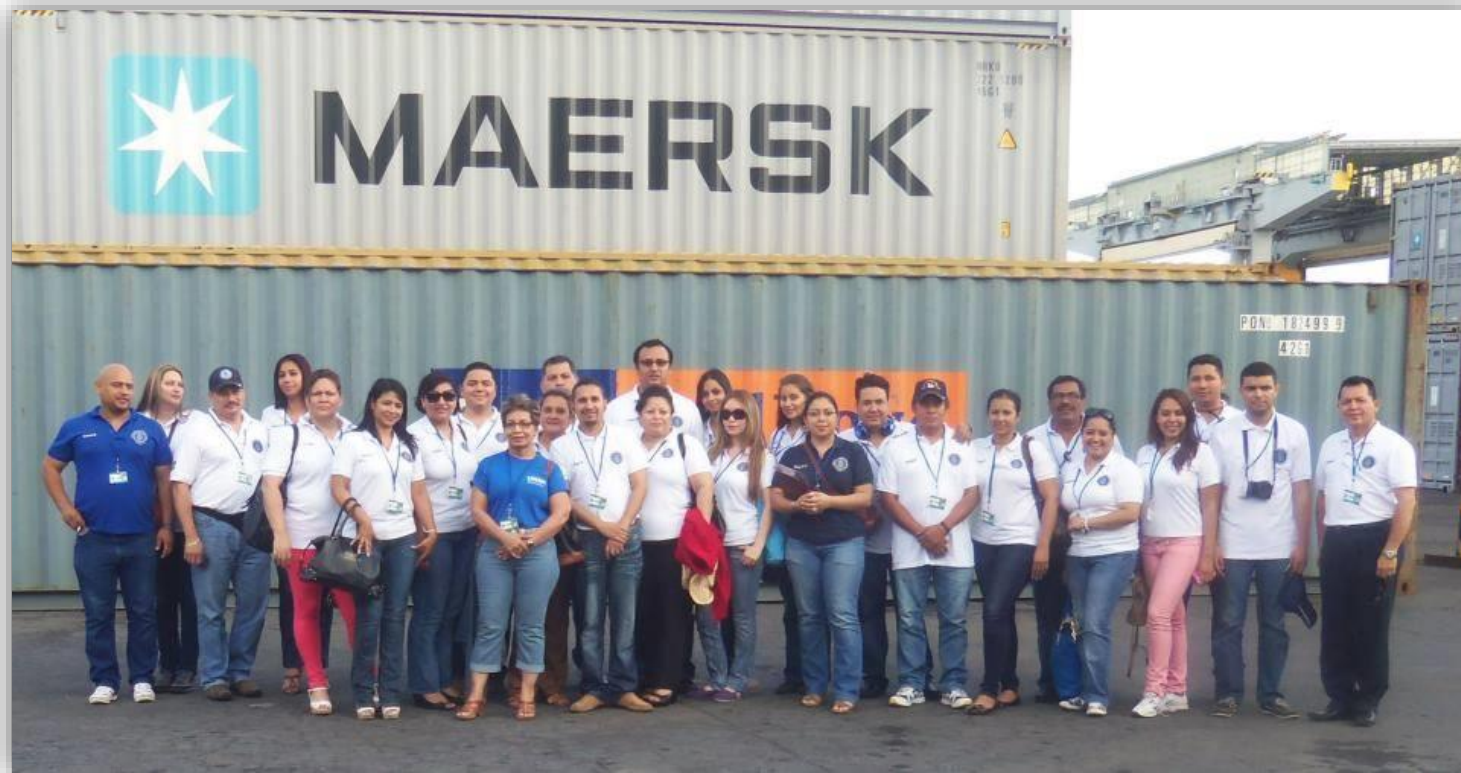
Viaje al Puerto de Corinto, Nicaragua. 2012