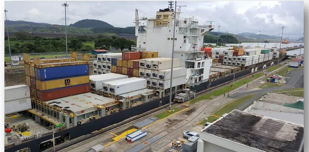
Autoridad Marítima de Panamá 2016