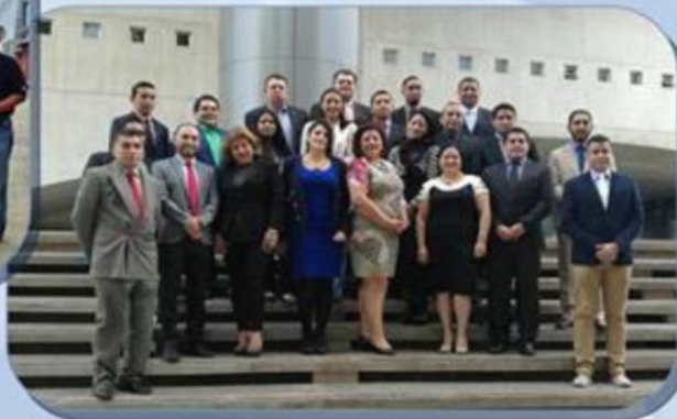
II Promoción 2014- 2016: Quienes realizaron vistas de campo a Puerto Cortes y Canal de Panamá.