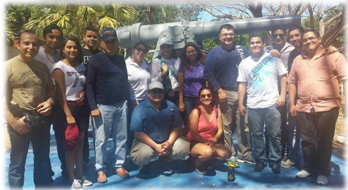
Viaje a Isla del Conejo, 2014